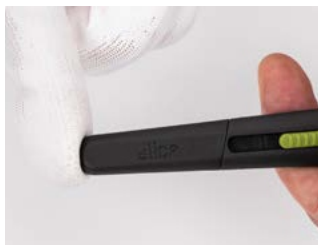
osłona ostrza musi się zatrzasnąć

Dla zwiększenia bezpieczeństwa przeczytaj uważnie poniższe wskazówki i stosuj się do nich. Prosimy o ostrożność podczas używania noża.