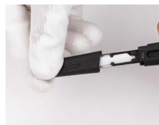
włóż z powrotem osłonę ostrza