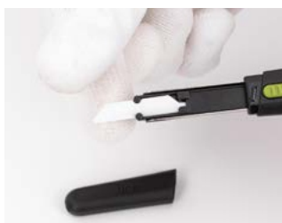
chwyć za ostrze