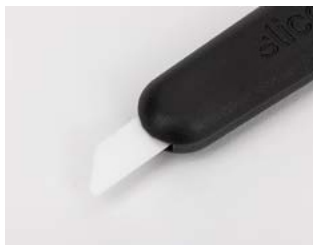
nóż jest gotowy do użycia