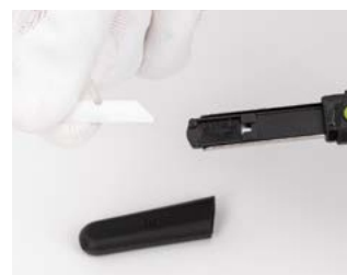
chwyć je i wyciągnij