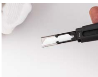
ostrze musi pasować w uchwycie