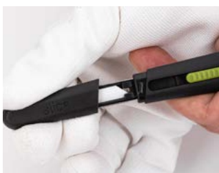
Chwyć za osłonę ostrza i wysuń ją do przodu